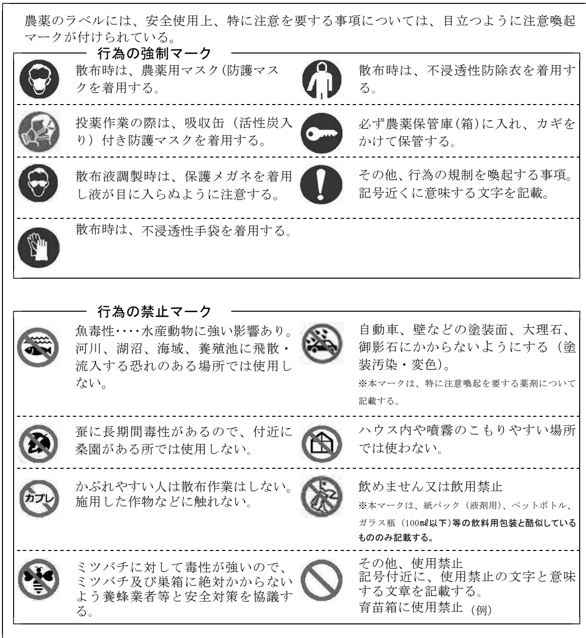
表-3 注意喚起マーク